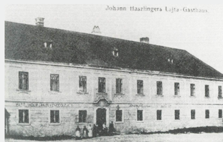
2 Leithagasthaus Neudörf

Die Gründung von Gewerkschaften und große Arbeiterdemonstrationen führten zu sozialen Verbes-