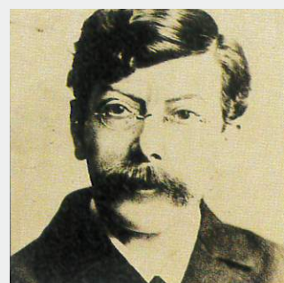
3 Viktor Adler, Parteigründer und Vorsitzender von 1889 - 1918

Begünstigt durch die Gründung der Arbeiterzeitung im Juni 1889 durch Viktor Adler, konnten die Ideen und Forderungen der jungen Bewegung schneller verbreitet werden. Viktor Adler war auch bis zu seinem Tod am 11. November 1918