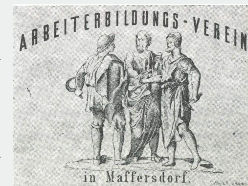
4 Plakat des Arbeiterbildungs-Vereines Mattersdorf

In Walbersdorf gab es im ausgehenden 19. Jahrhundert schon zwei Ziegeleien, deshalb wird vermutet, dass auch die Arbeiterschaft in diesen großen Betrieben organisiert war. Wer die führenden Personen in diesen Arbeiterräten waren, ist uns leider nicht bekannt.