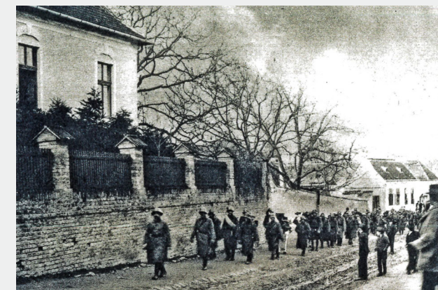
9 Einmarsch der Gendarmerie in Mattersdorf (Bahnstraße) im November 1921

mungsrecht für die Deutschen in Westungarn ein. Schon am 10. November 1918 wurde in Mattersdorf der „Deutsche Volksrat für Westungarn“ gegründet. Die Bestrebungen nach Autonomie vorwiegend im Norden und Anschluss an Österreich im Süden waren damals etwa gleich stark.