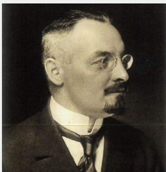
6 Otto Glöckel, Unterstaatssekretär für das Bildungswesen

Nach dem Ende des Ersten Weltkrieges und der Ausrufung der Republik Deutsch-Österreich übernahmen in einer großen Koalition die Sozialdemokraten bis zu den ersten Wahlen 1920 die Führung. Staatskanzler wurde Karl Renner, er führte die Friedensverhandlungen in St. Germain. Ferdinand Hanusch war Staatssekretär für soziale Fürsorge. Otto Glöckel, ein Pottendorfer mit mütterlicherseits Mattersburger Wurzeln, war Unterstaatssekretär für das Bildungswesen. Otto Bauer war Staatssekretär für Äußeres. Karl Seitz, der spätere Wiener Bürgermeister, wurde nach dem Tod Viktor Adlers 1918 Obmann der SDAPÖ. Er wurde auch vom Nationalrat zum ersten Staatsoberhaupt gewählt. 1920 ging die SDAPÖ nach starken Stimmenverlusten unter strategischer Führung von Otto Bauer bis 1934 in Opposition.